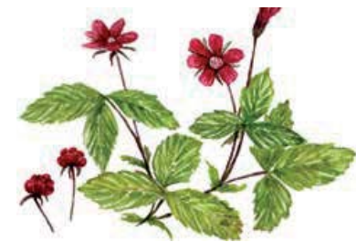
Åkerbär Rubus arcticus

Hitta: Reservaten ligger söder om Umeå, se beskrivning på nästa uppslag.