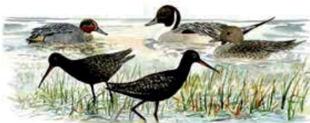
Kricka Anas crecca Stjärtand Anas acuta Svartsnäppa Tringa erythropus

Från plattformen har du utsikt över Västerfjärdens södra del med betande djur och rastande fåglar. Parkeringen ligger just efter du svängt av Obbolavägen.