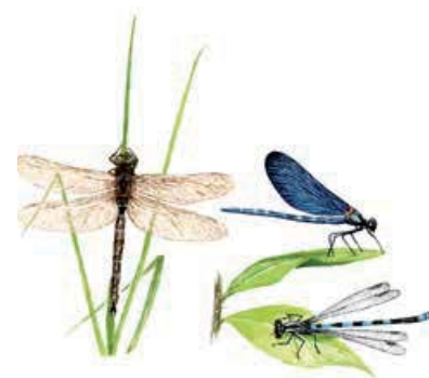
Brun mosaikslända Aeshna grandis Trollsländor håller vingarna utfällda när de inte flyger. Flick- och jungfrusländor faller ihop dem vid vila.

Den slingrande rampen ut till fågeltornet är lättgänglig och går genom granskog, lummig lövskog, buskmarker och över strandängar. Från tornet har du bra utblick över grunda områden och öar i Österfjärden. Fågelskådningen är bäst efter islossningen i april-juni. Under sommaren fylls buskmarkerna av surrande insektsliv. Villanäs är skyltat från Holmsundsvägen.