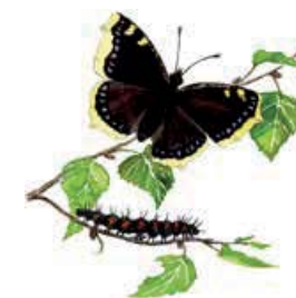
Sorgmantel Nymphalis antiopa