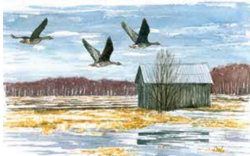
Degernässlätten har fina fågelmarker

En dubbelbeckasin lyfte just från ett grundområde nära Stora Tuvan. Nu flyger den mot fjällen. Ett ovanligt men möjligt fågelmöte en aprildag i Umeälvens delta. Grågås, sädgås, sångsvan, trana, tornfalk, blå kärrhök, kricka och bläsand kan däremot stå på artlistan efter ett par timmar.