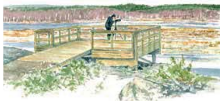
Tillgänglighetsanpassad ramp och utkiksplats finns vid Bergön.

Från Limpan, en limpformad utsiktsplats, har du bra överblick över Södra Degernässlätten. Här är det riktigt bra fågelskådning under mars och april då stora mängder fåglar rastar här. Limpan är tillgänglig för rörelsehindrade med ledsagare.