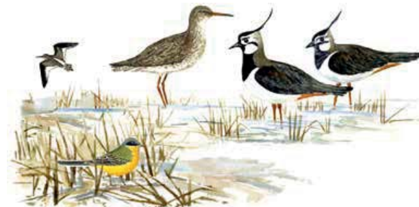
Rödbena Tringa totanus Tofsvipa Vanellus vanellus Gulärta Motacilla flava