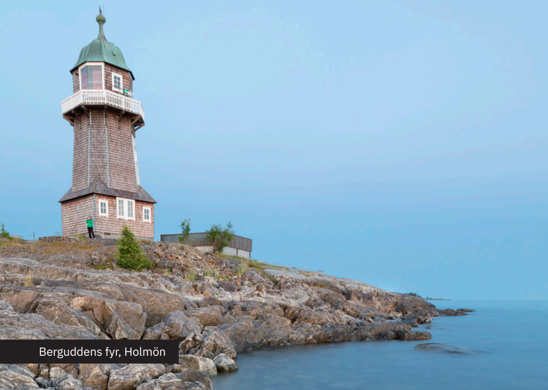
Berguddens fyr, Holmön