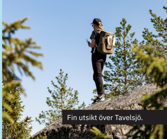
Fin utsikt över Tavelsjö.

En besöksguide som hjälper dig att hitta upp på tio berg i området runt Tavelsjö. För varje berg finns en markerad stig från dess fot upp till toppen. Välj mellan vandringar från 0,5 till 2,1 km (enkel väg) och stigningar som varierar mellan 46 och 165 höjdmeter. När du bestigit alla berg har du tagit mer än 1 000 höjdmeter.